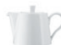
Kavinukas (360 ml) 2 min. 33 sek.