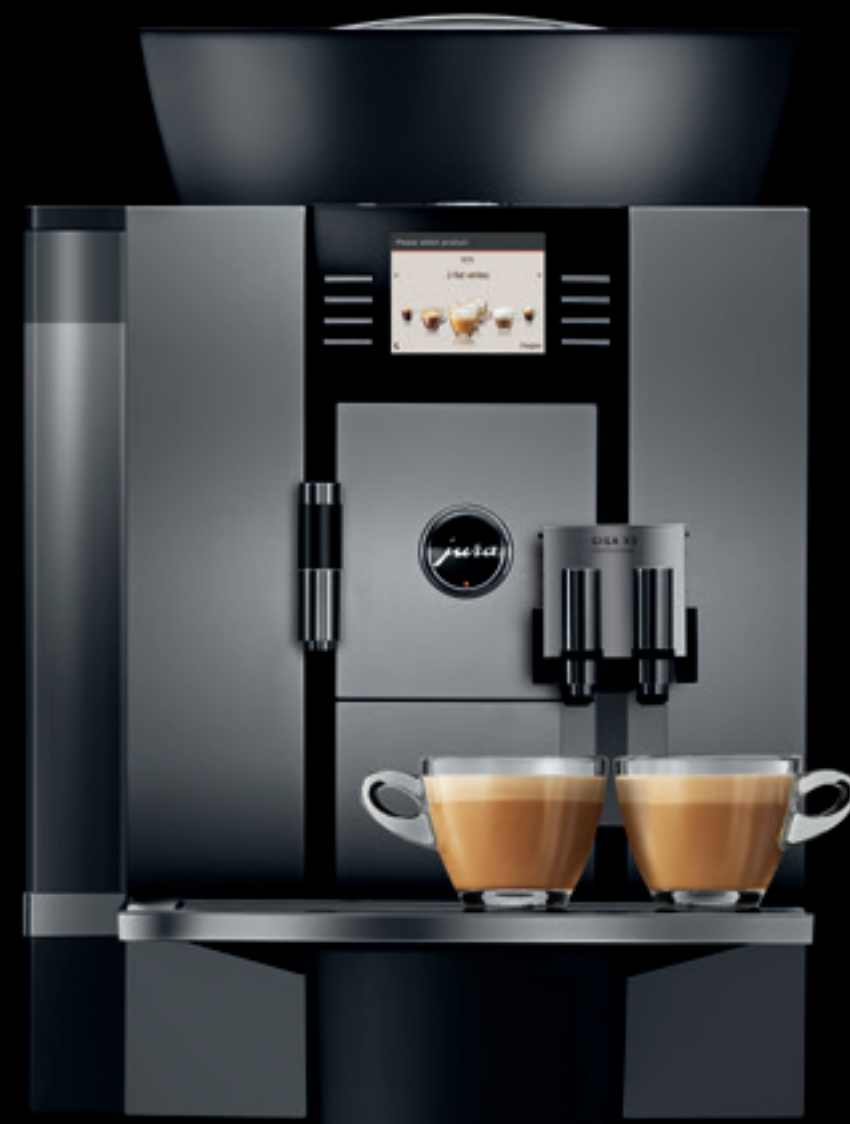
GIGA X3 Professional

Galite rinktis įvairiausių priedus: puodelių šildytuvą, pieno šaldytuvą, kavos tirščių šalinimo ir nuotekų nuvedimo rinkinį, mokėjimo sistemoms skirtą MDB apskaitos sąsają bei įvairius patrauklius aparatui laikyti ir pastatyti skirtus baldus – Jūs patys galite sukurti išbaigtą komplektaciją, atitinkančią Jūsų reikalavimus.