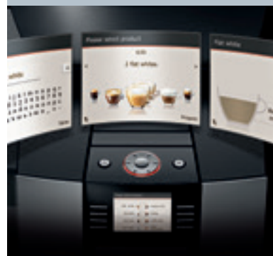
Individualiems poreikiams pritaikomas pradinis ekranas