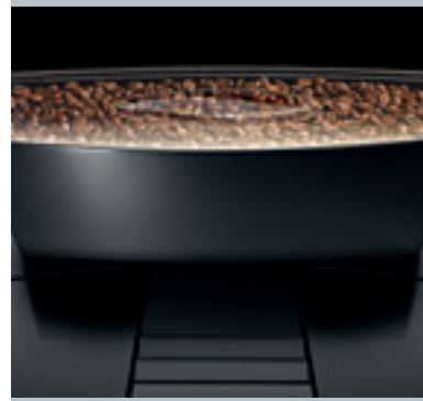
Aukštos kokybės keraminis diskinis malūnas