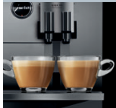
Reguliuojamas dvigubas kavos piltuvėlis (2 kavos ir 2 pieno piltuvėliai)