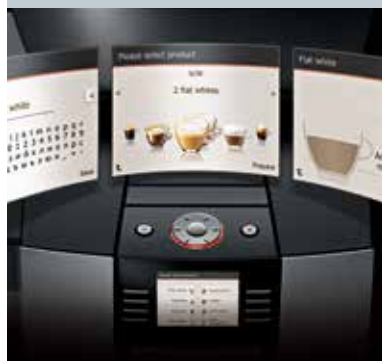
Programozható kezdő képernyő