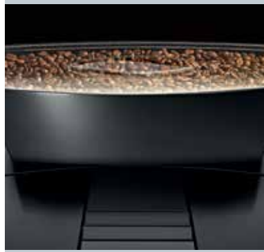
Professzionális kerámia őrlőfej