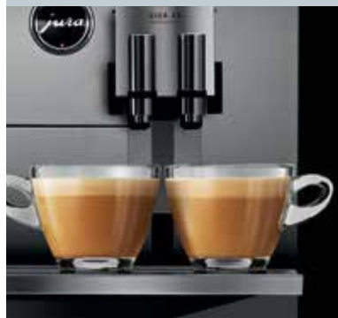
Két-két állítható kávé- illetve tejjhabkifolyó