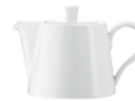
Kanna kávé (360 ml) 2 perc 33 másodperc